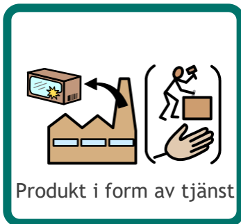
Produkt i form av tjänst